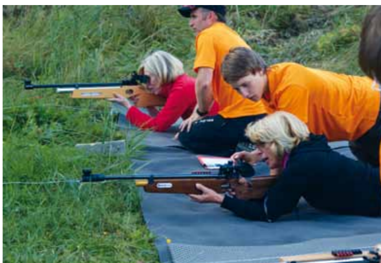
Beim Schießen sind Körper und Geist in vollster Konzentration.

Unsere speziell entwickelten Biathlon-Sommerbewerbe sind beliebte Programme, um sowohl den Teamgeist zu fördern als auch die Stärken jedes einzelnen Teilnehmers zu nutzen. Treffsicherheit und Präzision sind beim Schießen gefragt – unter vollster Konzentration und mit einer ruhigen Hand, was sich jedoch mit einem erhöhten Puls nicht gerade als einfach herausstellt. Schließlich muß man vorab einen Hindernisparcours meistern oder seine Ausdauer beim Laufen, Nordic Walking oder Biken unter Beweis stellen. Wie man sieht, sind die Möglichkeiten bei den Biathlon-Staffelbewerben vielfältig und können individuell auf Ihr Team abgestimmt werden.