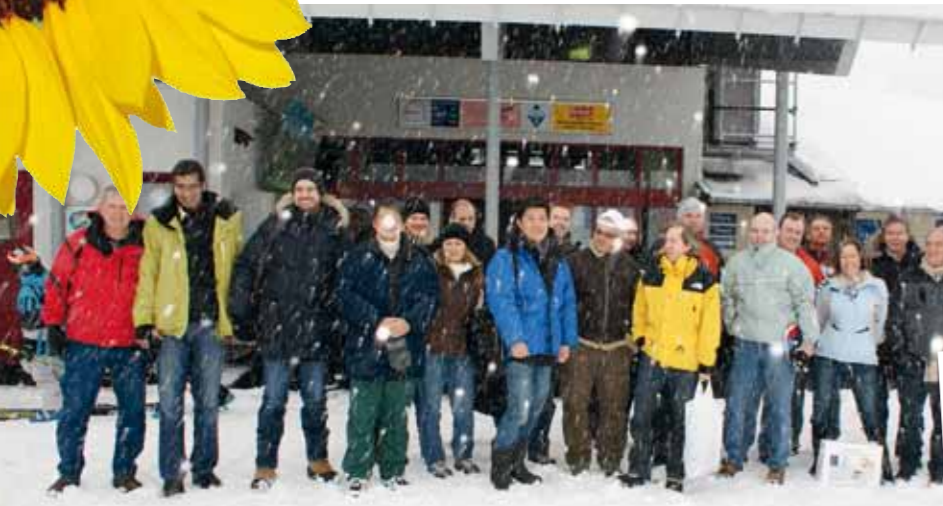
Global Sales Meeting 2011 von SCM Microsystems auf 1300 m Seehöhe