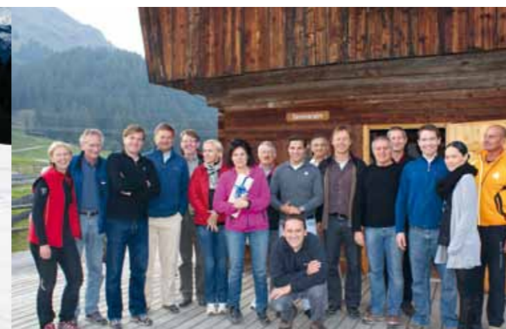
Nach dem Workshop der Firma Sandoz auf der Seminaralm wurde beim Biathlon-Teambewerb die Treffsicherheit unter Beweis gestellt.