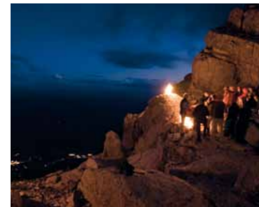
Sonnenaufgangswanderung – ein unvergessliches Erlebnis