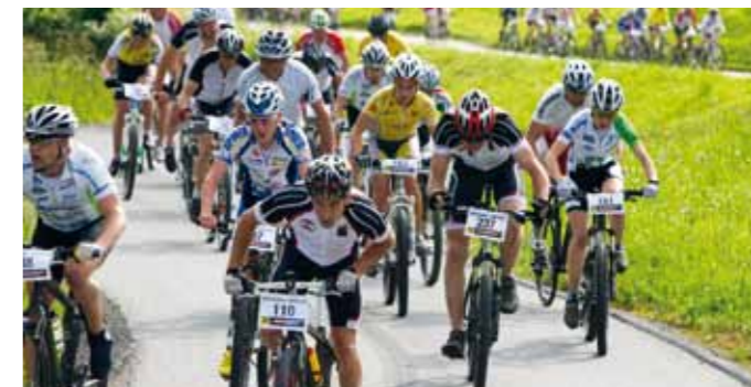
Beim Hillclimb versammeln sich die weltbesten Bergfahrer, Hobbyathleten und Mountainbike-Begeisterte

Anmeldung unter: office@hochgenusstour.at