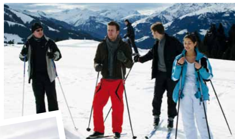
Beim Langlaufen, Skifahren und Schneeschuhwandern erlebten die Mitarbeiter der Firma Reichhart Logistik unter dem Motto „Sport und Genuss“ einen abwechslungsreichen und unterhaltsamen Wintertag.