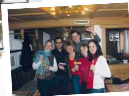
Software Spezialisten von Kraft Food unter sich – auf der Melkalm bei tiefwinterlichen Verhältnissen