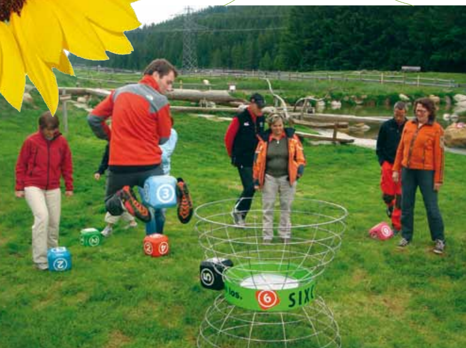
SIXCUP fordert und fördert die Geschicklichkeit der Teilnehmer.

Geschwindigkeit, Geschicklichkeit und Glück – mit dieser Kombination sorgt die innovative Funsportart SIXCUP für jede Menge Spaß, Spannung und Unterhaltung. Ziel ist es, große Schaumstoffwürfel lediglich mit Hilfe der Füße in unterschiedlich hohe Körbe – den sogenannten Cups – zu befördern. Dieses neue Konzept ist besonders beliebt bei Vereinen sowie bei Teambuildings im Zuge von Firmen-Seminaren und Incentives. Das Spiel kennt verschiedene Varianten und kann somit jederzeit und überall an die Wünsche und Bedürfnisse der jeweiligen Spieler angepasst werden. SIXCUP stärkt den Teamgeist, die Sozialkompetenz und ermöglicht ein besonderes Gemeinschaftserlebnis.