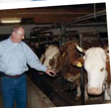
Die Novartis-Gruppe lud Pharmareferenten und Tierärzte aus 12 Ländern zum Meeting in den Bergen.